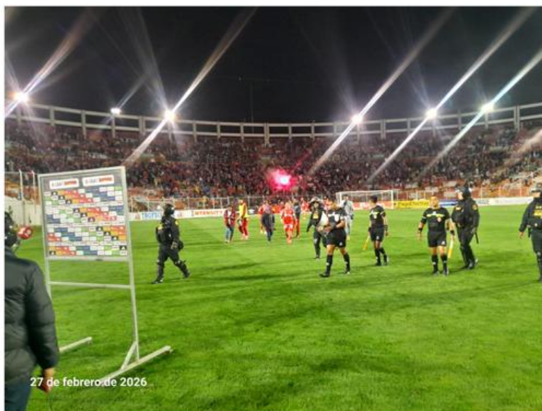
FOTO DE BENGALA TRIBUNA NORTE HINCHAS DEL CLUB CIENCIANO FINALIZADO EL PARTIDO